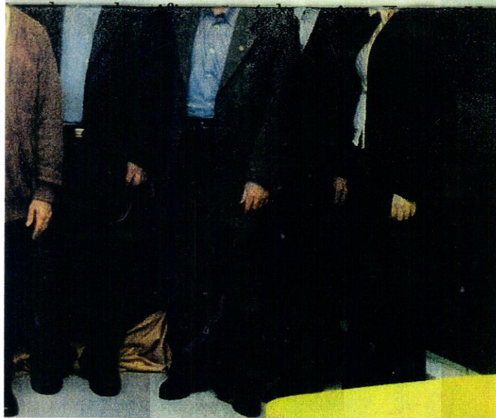
u ontem, em Maringá